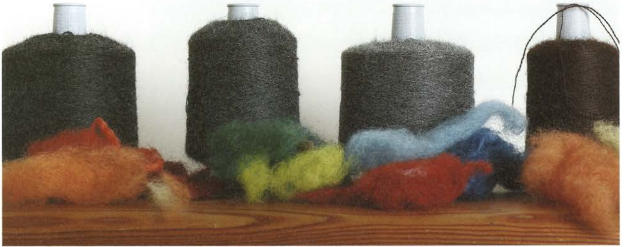
Alpaka-Wolle und pflanzengefärbte Schafwolle.

machte Blanke eine schöpferische Entwicklung durch, die sich von der Gestaltung komplexer Muster hin zu einer wohlüberlegten Auslotung einer grösstmöglichen Reduktion zeigte. Für Blanke bedeutete dieser Prozess eine Loslösung vom sich selbst auferlegten Drang nach Perfektion und Komplexität und mündete schliesslich in der Intention, Textilien zu kreieren, deren Charakteristik hauptsächlich darin besteht, mittels minimaler Eingriffe scheinbare Monotonie dennoch changieren zu lassen sowie eine schlichte Sinnlichkeit zu erzielen. Exemplarisch sollen hierfür zwei Schöpfungen Eva Blankes vorgestellt werden: Einmal wollene Schultertücher in den Farben Hellgrau, Anthrazit, Braun oder Beige, die sich dank des nachträglichen Walkens besonders weich an den Körper schmiegen; diese werden durch einen einzigen, in der Mitte angebrachten handgesponnenen sowie naturgefärbten roten Wollfaden geteilt und zugleich miteinander verbunden. Dann ein handgewobener Teppich, der