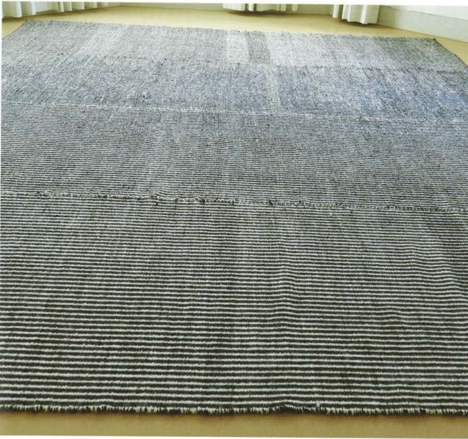
Teppich aus Walliser Schafschurwolle.