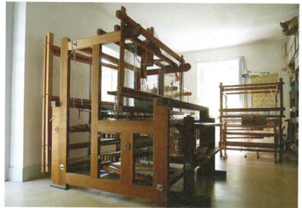
Blankes Handweberei in Chur.

Der kreative Prozess beginnt für Eva Blanke mit einer ersten Skizze auf Papier, es folgen kleinformatische Musterarbeiten bis hin zum fertigen Produkt: Teppiche, Bettüberwürfe, Tücher, Schals, Ponchos oder auch Leinentaschen sowie Leuchten. Dabei ist es für sie zentral, für ihre Arbeiten ausgewählte naturbelassene sowie