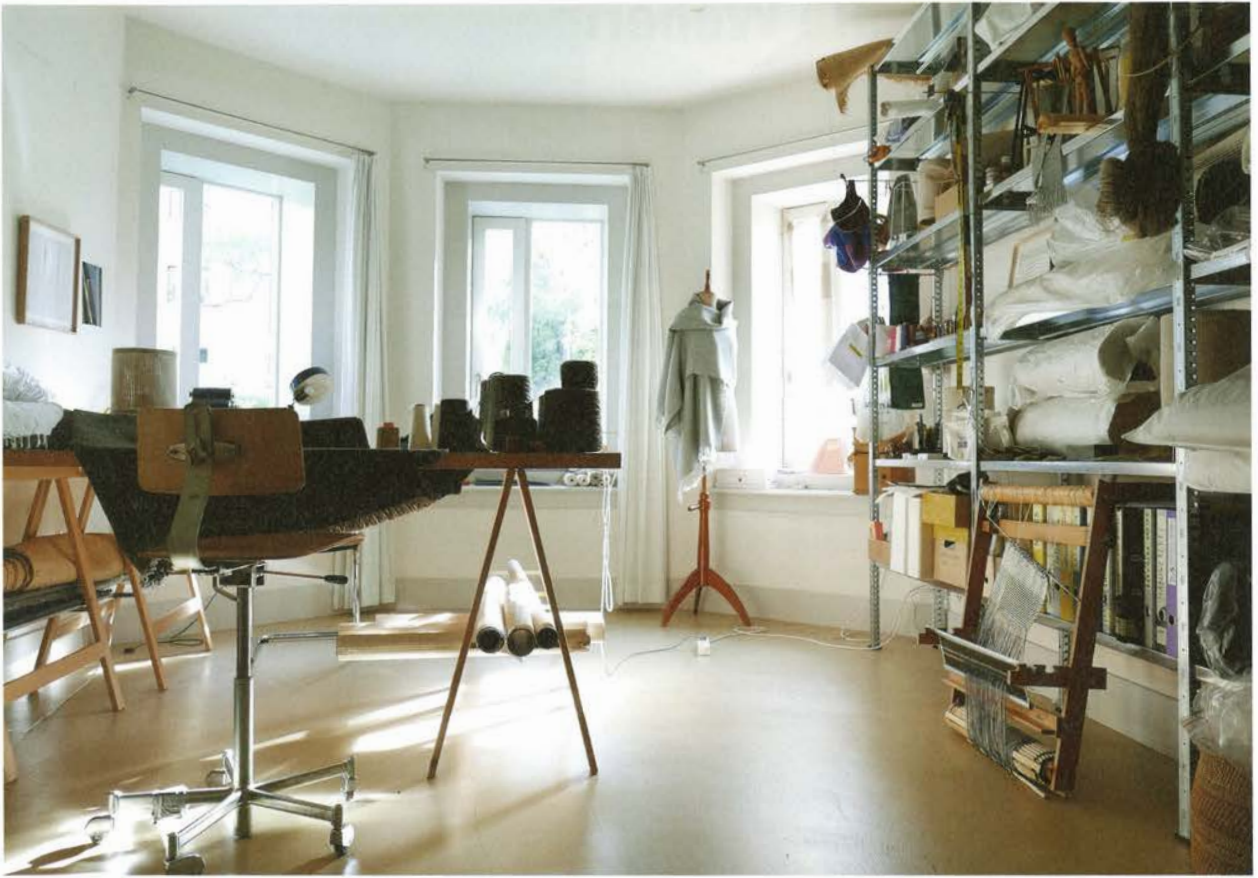
Blankes Handweberei in Chur.

lichen Bilderwelt das Attribut der Spindel. Wegen der sich gleichmässig drehenden resp. regelmässig wiederholenden Bewegung galten Spinnrad und Webstuhl als Symbol unabänderlicher Gesetzmässigkeit; aus ihnen ging im Volksglauben der Faden des Lebens, des Schicksals hervor. (Vgl. Manfred Lurker, Wörterbuch der Symbolik)